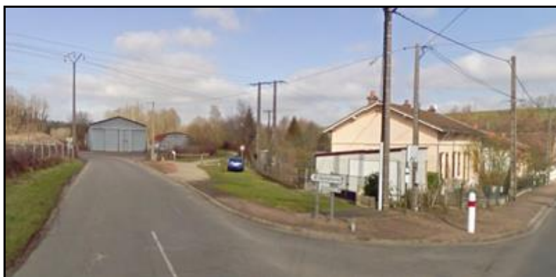
Le début de la piste cyclable