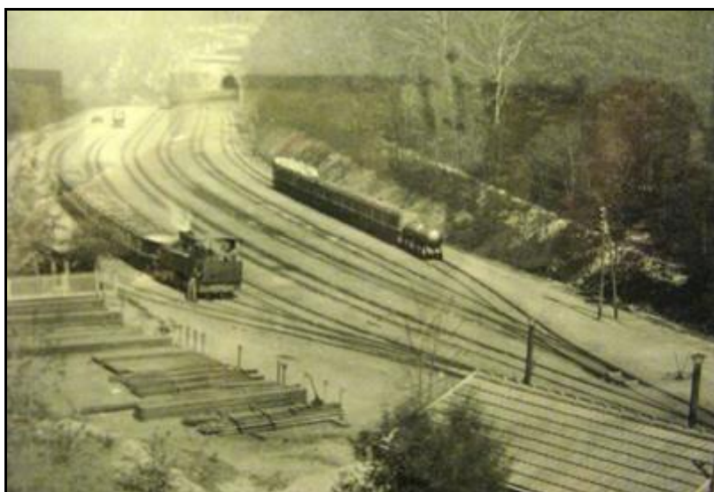
Photo ancienne montrant le faisceau d'attente des Glenons située à l'entrée sud du grand tunnel dont on devine l'orifice dans le fond

En 1873, face aux nouveaux puits et aux améliorations apportées à la production, ce système devient beaucoup trop lent. Les Schneider décident donc de revoir complètement le schéma d'évacuation du charbon. La production des divers puits périphériques est toujours centralisée sur les Zagots puis, de là, acheminée par un nouveau tunnel de 700 m de long (l'ancien sera bouché) vers un centre de tri et de lavage aménagé au Pré Charpin, au départ du vallon de Fond Judas. Le transit entre ces deux points s'effectuera désormais par des trains de berlines tractés par des petites locomotives à vapeur ou à air comprimé.