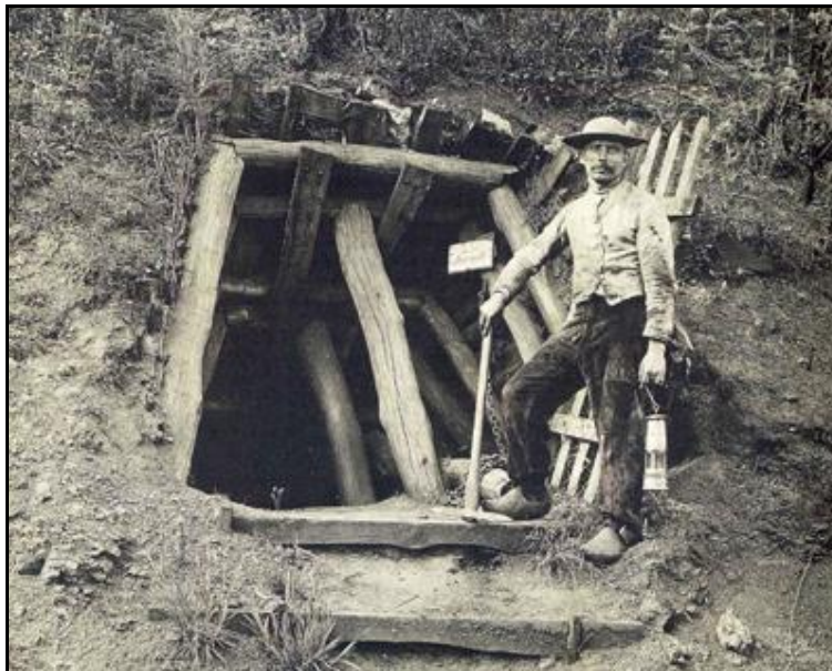
Les premières exploitations souterraines : descenderie de mine

L'extraction du charbon sur le site du bassin de La Machine semble très ancienne. D'abord réalisée à ciel ouvert à partir des affleurements de surface, elle devient progressivement souterraine dès le XVI e siècle.